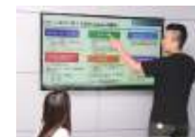
ドローンスクール