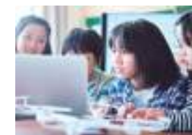
プログラミング教室