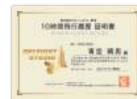
10時間飛行履歴 証明書