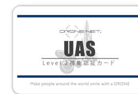
ドローンネット認定 UAS レベル2資格証